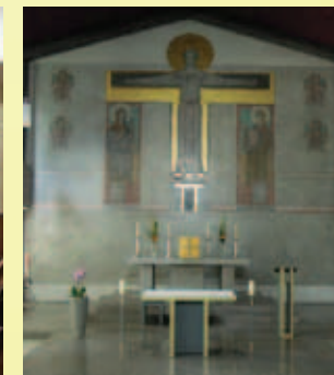
Maria Heil der Kranken katholische Kirche

Sollten wir Ihnen bei unseren Besuchen auf den Stationen nicht begegnen, können Sie auch telefonisch Kontakt mit uns aufnehmen. Gerne übermitteln auch Pflegekräfte oder Ärzte Ihren Besuchswunsch.