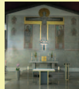
Maria Heil der Kranken katholische Kirche

Sollten wir Ihnen bei unseren Besuchen auf den Stationen nicht begegnen, können Sie auch telefonisch Kontakt mit uns aufnehmen. Gerne übermitteln auch Pflegekräfte oder Ärzte Ihren Besuchswunsch.