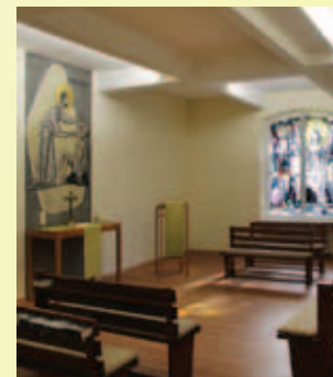
Hephata - Kapelle evangelisch

Wir besuchen Sie gerne in Ihrem Zimmer, verfügen aber auch über Räume für ungestörte Gespräche. Gespräche werden vertraulich behandelt.